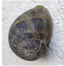
Estivation d' Helix aspersa . Escargot petit gris.

L'hibernation et l'estivation. Dans les conditions défavorables, l'Escargot cesse toute activité. Dès les premiers froids d'octobre, l'animal peut rentrer en léthargie jusqu'au printemps suivant. Il vit enterré et operculé sur ses réserves. En période de sécheresse, on rencontre le même ralentissement d'activité.