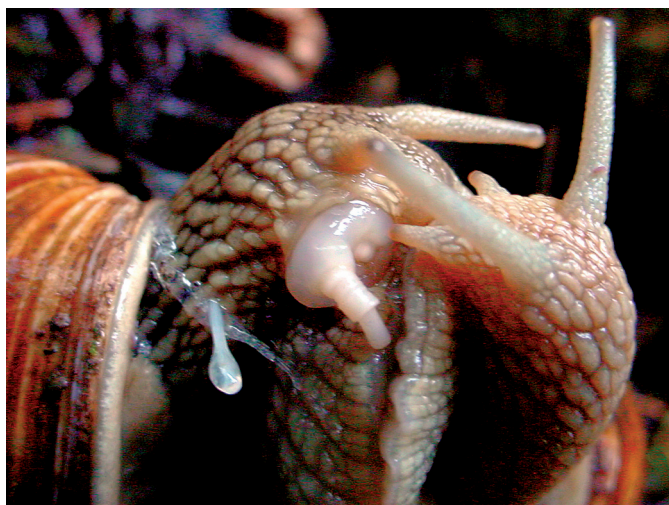
Photographie 3. Phase de post-copulation. Dans l'atrium génital, élargi au maximum, on observe l'orifice vaginal et le pénis constitué de trois parties télescopiques, la région distale étant déjà en partie rentrée dans la région moyenne.

L'accouplement de l'Escargot de Bourgogne a lieu de la mi-avril à la fin mai. Il est précédé d'une phase de pré-accouplement au cours de laquelle les partenaires se font face et accolent leur sole de reptation sur toute leur longueur, comme s'il s'agissait d'une phase de reconnaissance spécifique (photographie 1). L'ensemble se dresse verticalement effectuant des mouvements de pendule tandis que les tentacules se touchent et se caressent et que les animaux se mordent, cette première phase dure de 15 à 45 minutes. Alors que les atriums génitaux commencent à s'ouvrir, les partenaires se frottent côté droit de l'un contre le côté droit de l'autre, les soles de reptation se dissociant dans la région antérieure. C'est au