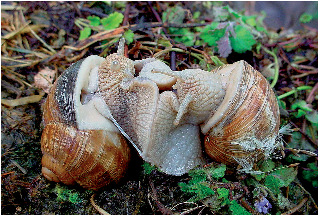
Photographie 1. Phase de pré-accouplement. Les partenaires se font face et accolent leurs soles de reptation sur toute leur longueur. Le pneumostome de l'individu de gauche est béant.

(1) Le corps d'Hermaphrodite, fils d'Hermès et d'Aphroïtite, s'étant fusionné lors d'une étreinte prolongée avec celui d'une Nymphe, possédait les attributs des deux sexes.