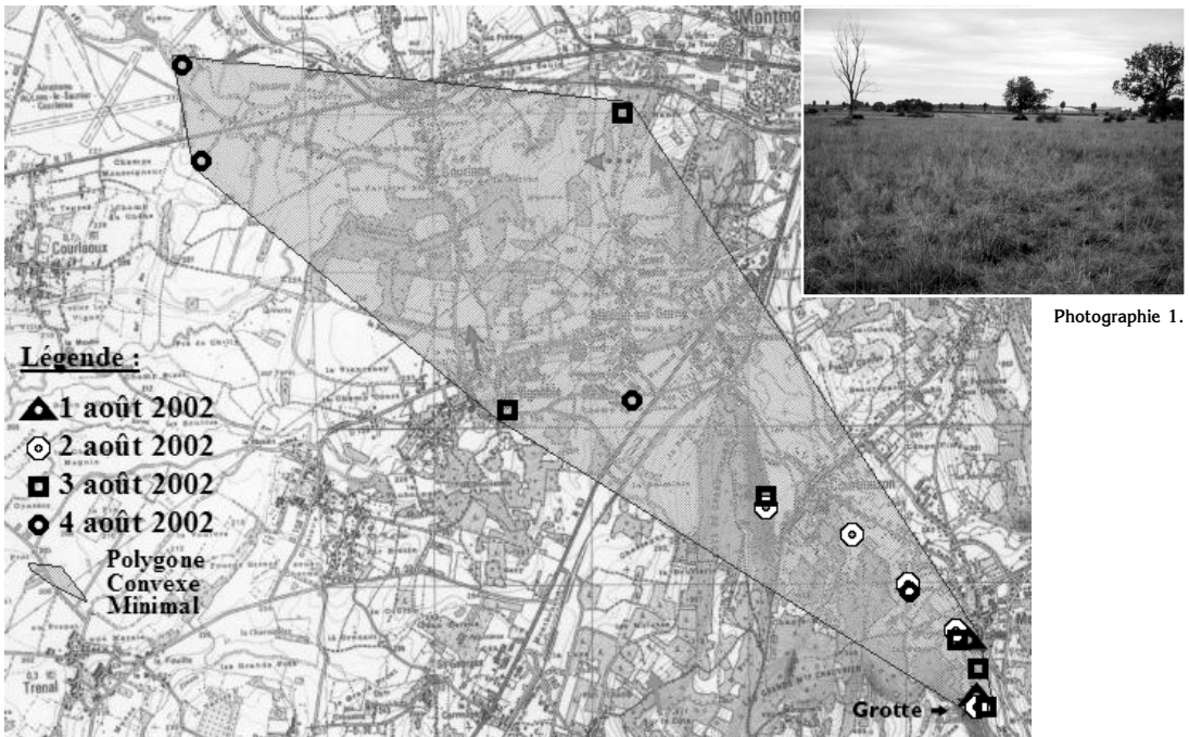
Carte 1. - Polygone convexe minimal du Petit murin défini par le suivi