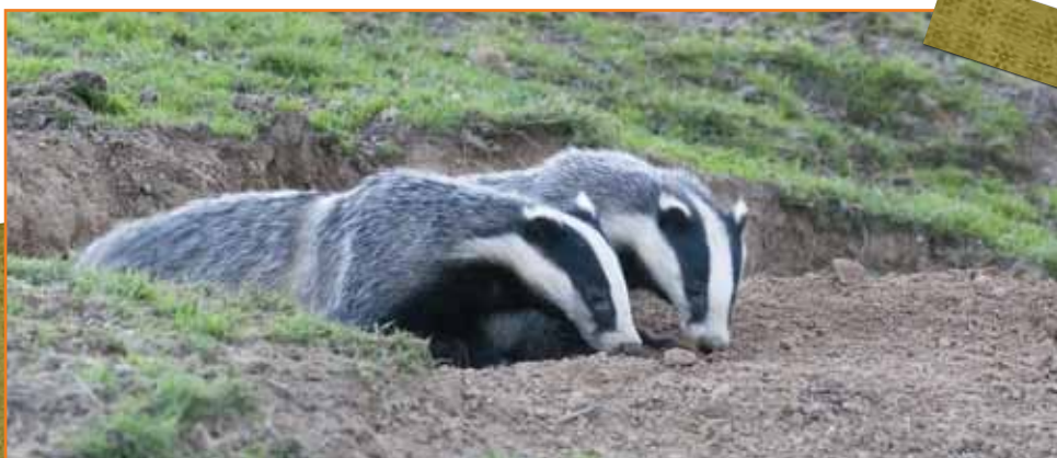
Blaireaux sortant de leur terrier

La tuberculose bovine (TB) est une maladie qui affecte les bovins d'élevage et sauvages , mais aussi de nombreux animaux sauvages, mammifères autres que les bovins. Mycobacterium bovis est la bactérie responsable de cette maladie. Elle appartient à la même famille de bactéries que le bacille de Koch (BK) responsables de diverses formes de tuberculose humaine. Elle en est très proche génétiquement, mais avec un agencement différent des gènes. C'est à partir d'une forme atténuée de ce bacille qu'est produit le vaccin BCG (vaccin bilié de Calmette et Guérin). Mycobacterium bovis peut franchir la barrière des espèces et infecter l'Homme. Elle est donc classée parmi les « zoonoses » (infections naturellement transmissibles de l'animal à l'homme et vice versa). En France, elle avait presque disparu grâce à de nombreux contrôles sanitaires, permettant à notre pays d'être déclaré « officiellement indemne de tuberculose bovine ». Cependant, depuis quelques années, on constate un retour de la maladie chez les bovins dans plusieurs départements où des animaux sauvages ont également été trouvés infectés. Or, on ne sait pas si ces espèces sauvages sont capables d'entretenir la tuberculose et de la transmettre aux bovins.