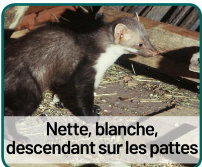
Nette, blanche, descendant sur les pattes