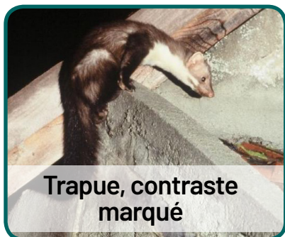
Trapue, contraste marqué