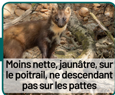
Moins nette, jaunâtre, sur le poitrail, ne descendant pas sur les pattes