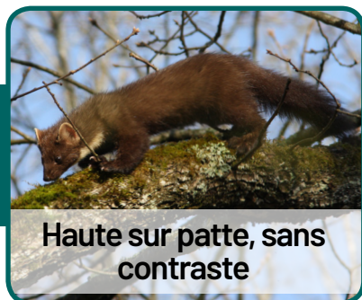
Haute sur patte, sans contraste