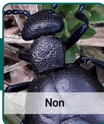
Méloé printanier ( Meloe proscarabeus )

Base du pronotum avec une impression transversale