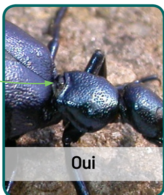
Méloé violacé ( Meloe violaceus )

Base du pronotum avec une impression transversale