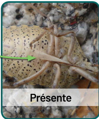
Punaise diabolique Halyomorpha halys